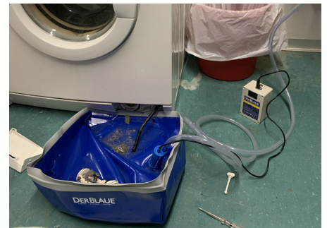
Flusensieb auf Bodenhöhe entleeren