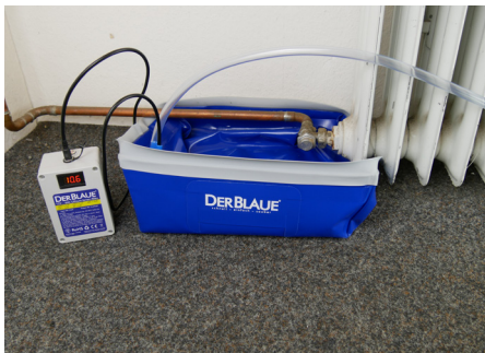
Heizkörper bis zu 10x schneller entleeren