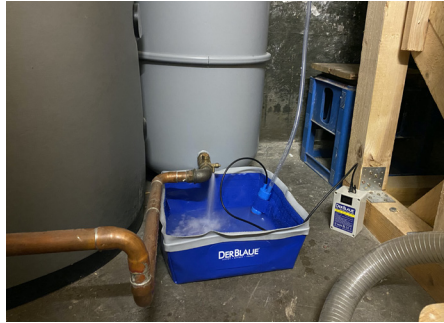
Speicher entleeren und in den Ablauf pumpen