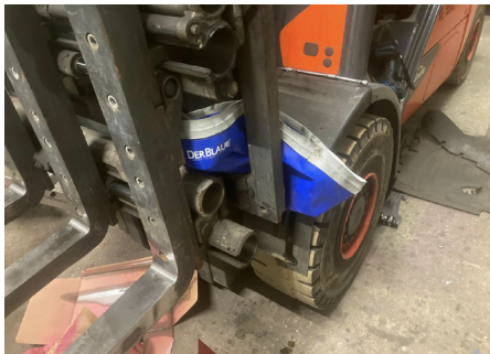
Kundendienst an zahlreichen hydraulischen Maschinen und Geräten, auch in engen Einbausituationen